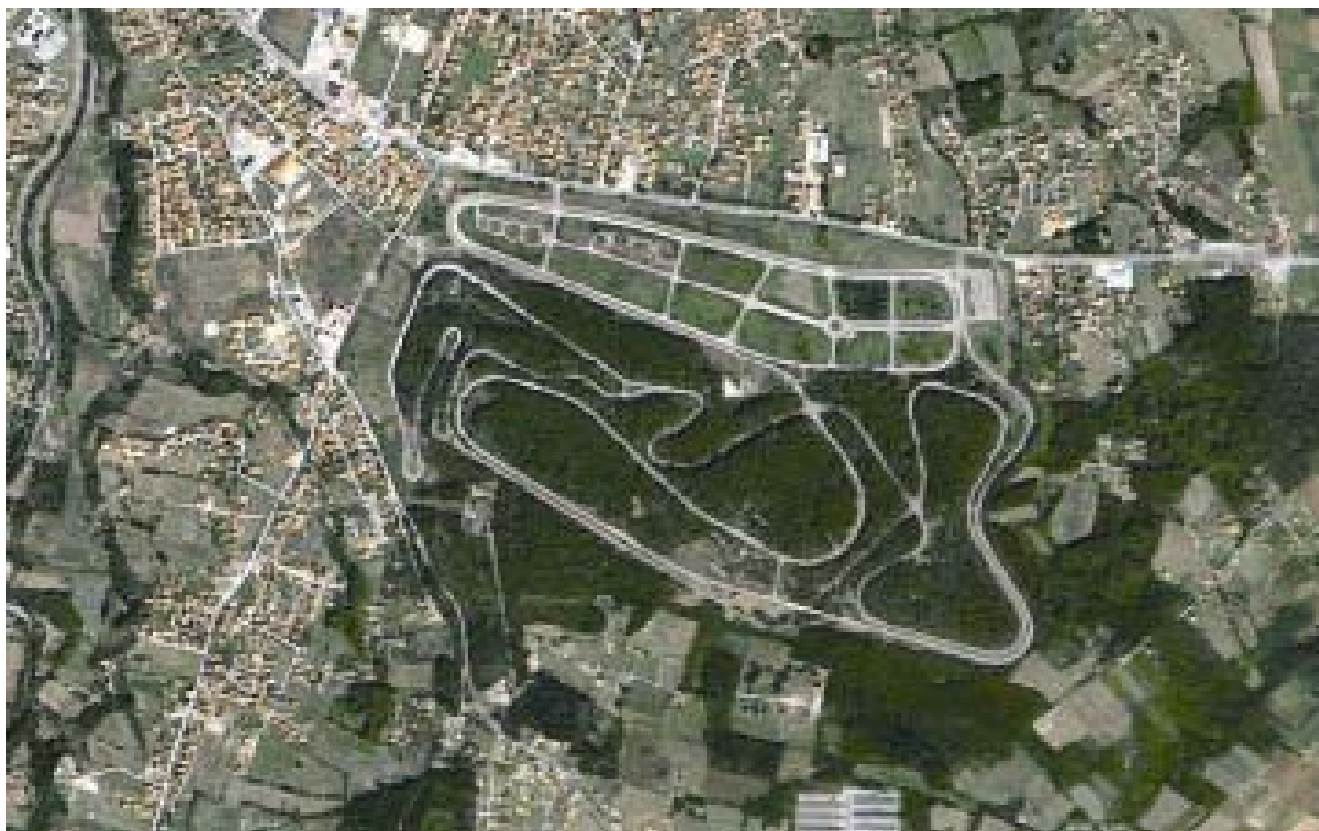
Satelitski snimak autodroma 'Beranovac' u Kraljevu

KRALJEVO - Autodrom "Beranovac" kod Kraljeva izgrađen je sredinom prošlog veka i važio je za najbolju kružnu stazu za auto i moto trke ne samo u bivšoj Jugoslaviji, već i na Balkanu.