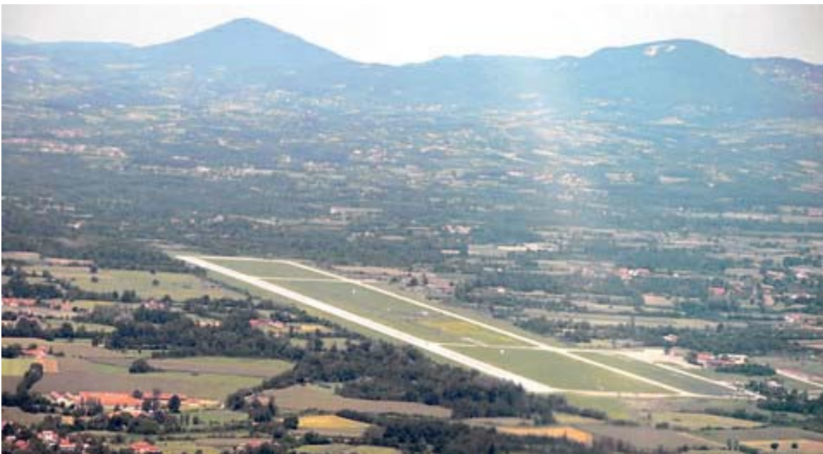
Vojni aerodrom u Lađevcima kod Kraljeva

Miroljub Dugalić objavljeno: 17.02.2011.