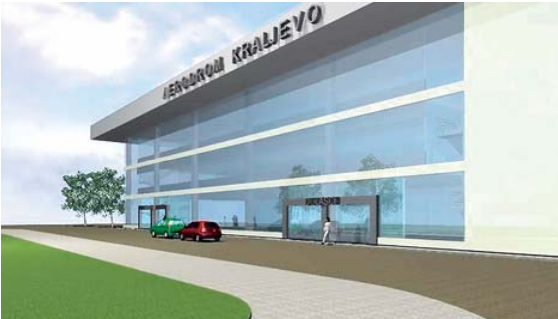
Kompjuterski prikaz pristanišne zgrade

Započeti su radovi na prilagođavanju vojnog aerodroma „Lađevci” kod Kraljeva za civilni vazdušni saobraćaj. – Krajem godine sletće prvi putnički avioni