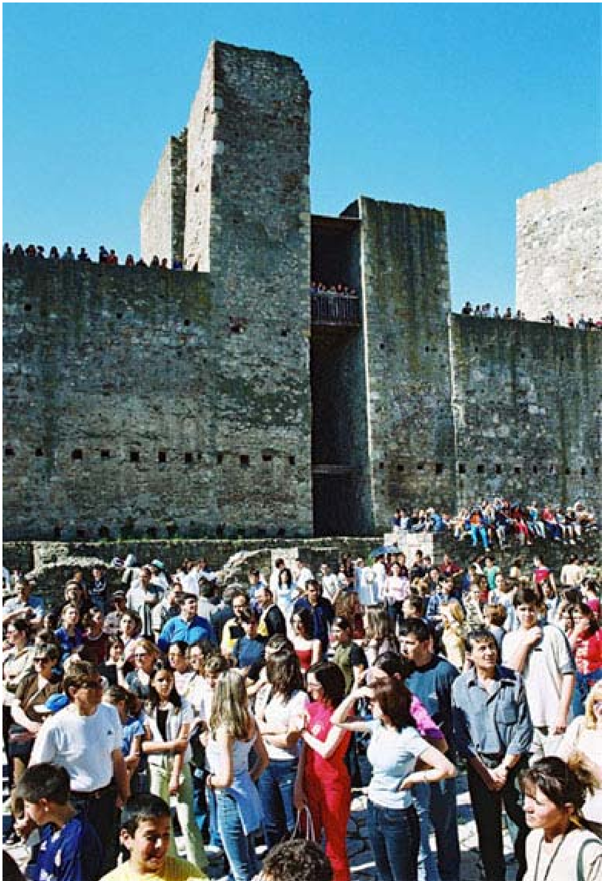
Ambijentalni pozorišni festival "Tvrđava teatar"

DOMAĆI I STRANI IZVOĐAČI SU SAGLASNI : NAJAKUSTIČNIJI IZVOĐAČKI PROSTOR IKADA DOŽIVLJEN