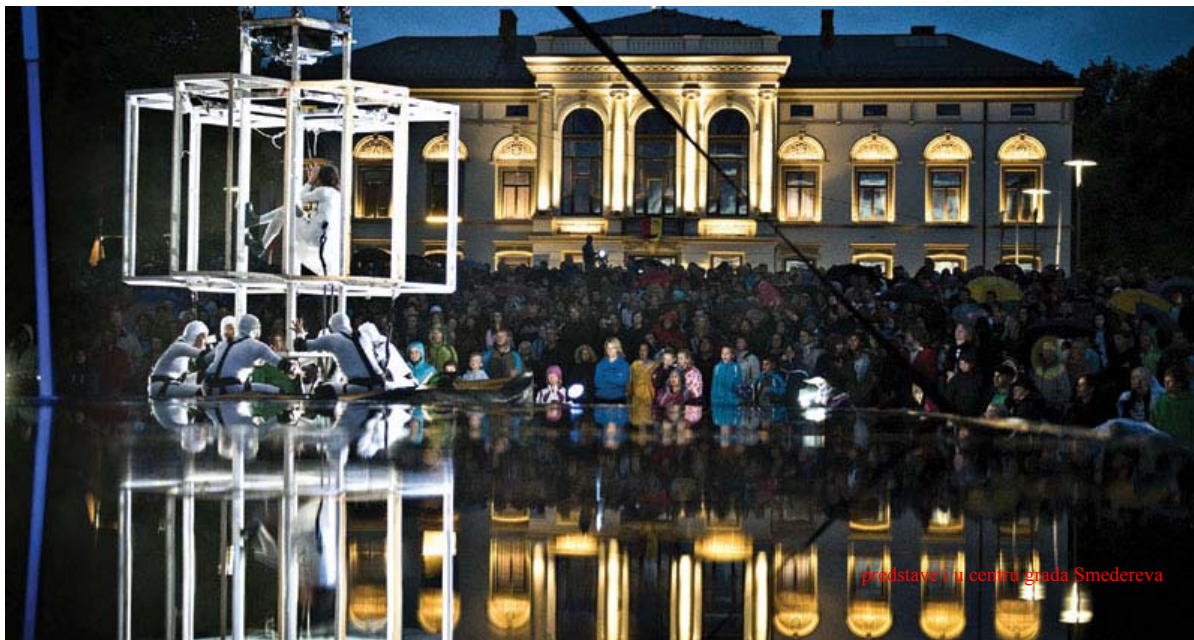
Deo programa festivala se izvodi u centru grada Smedereva

"Teatar Puho" proslavio se posebnim izvođačkim disciplinama objedinjenim u jednom nastupu - teatru, cirkusu, plesu, visinskim sportovima. Izveli su više od 200 predstava u 20 zemalja. Nastupili su na otvaranju Evropskog šampionata u atletici 2006. godine u Švedskoj, kada je nebesku predstavu videlo oko 250 miliona gledalaca širom sveta.